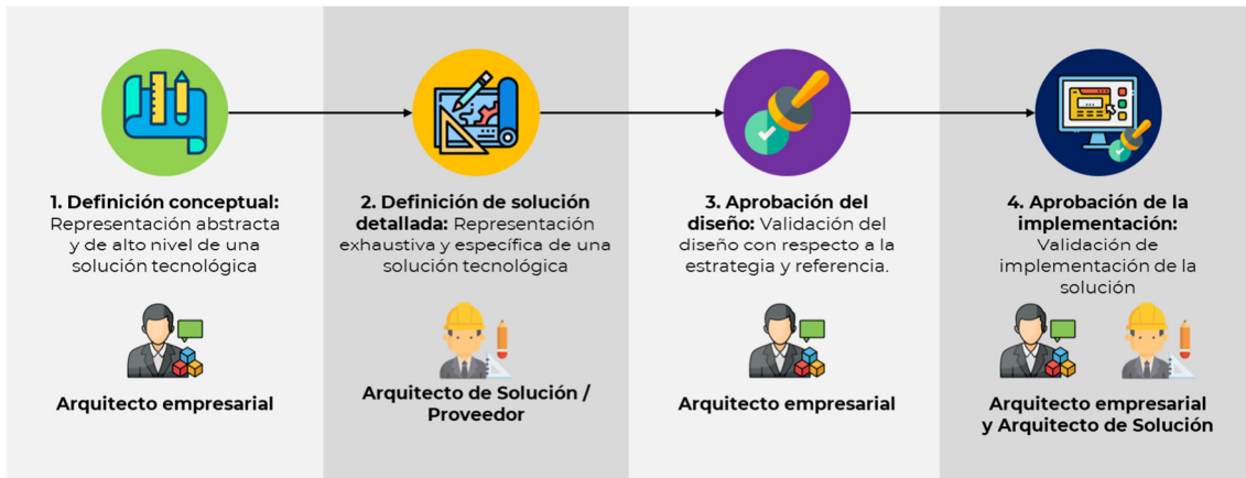
Ilustración 3. Modelo de gobierno de arquitectura – estado objetivo