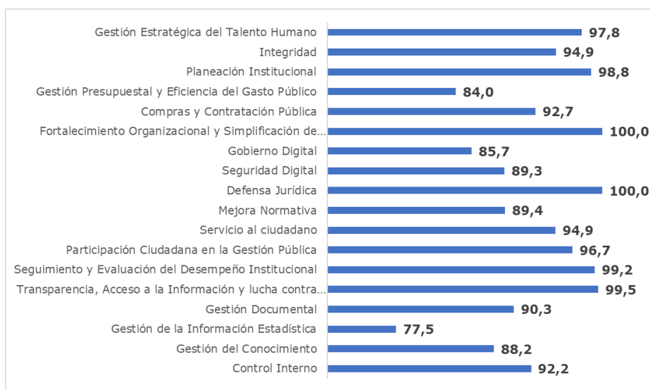
Gráfico 2: Índices por políticas de gestión y desempeño 2022